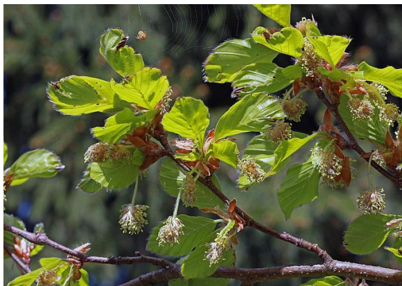
Fig. 1. Les fleurs mâles du hêtre se présentent sous forme de chatons.

Les fruits du hêtre – les faînes – ressemblent à de minuscules châtaignes triangulaires. Ils sont enfermés à deux, ou plus rarement à trois, dans une cupule ligneuse hérissée d'épines blanches molles et recourbées (Fig. 2). Les fruits mûrissent au cours de l'été et se détachent des cupules ouvertes à partir de la mi-septembre, ou tombent avec elles entre octobre et novembre.