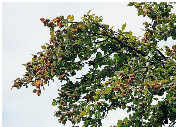
Fig. 3. Fructification dense.