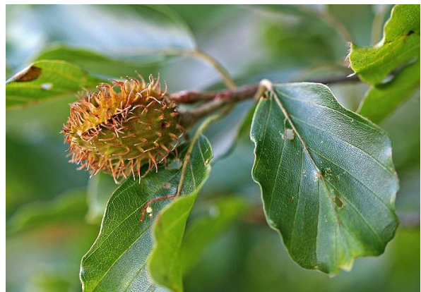
Fig. 2. Cupule hérissée d'épines molles.