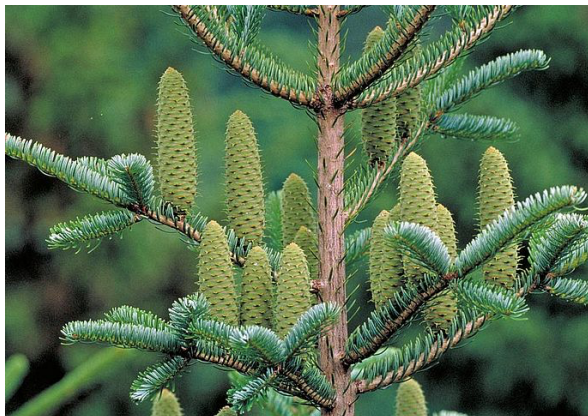
Fig. 1. Les cônes frais du sapin blanc sont verts et se dressent vers le haut dans la cime.

Les cônes mûrissent en septembre et restent dressés vers le haut. Ils se situent seulement le long de rameaux au niveau de la cime (Fig. 3). En octobre, les écailles des graines tombent et les petites graines ailées sont disséminées par le vent. Seule la chandelle (Fig. 2) demeure, qui peut parfois rester sur la branche pendant plusieurs années.