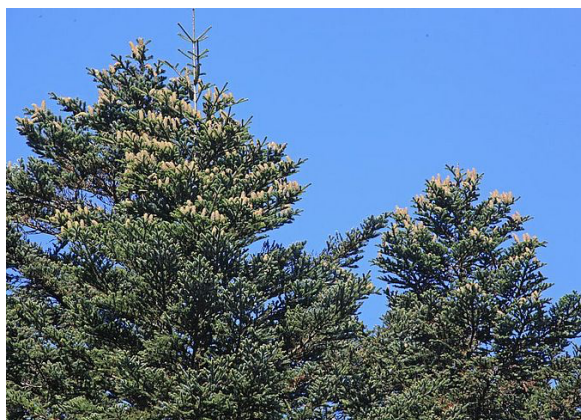
Fig. 3. Fructification complète avec une densité élevée de cônes sur la cime de tous les arbres prédominants.