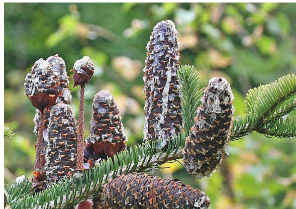
Fig. 2. Les écailles des graines des cônes mûrs, désormais bruns, tombent en octobre. Les chandelles (à gauche) demeurent sur la branche, dressées vers le haut.